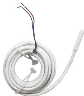
Tillbehör - Extern givare 10 kΩ vid 25°C